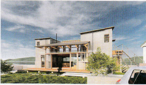
窓をテーマに設計した住宅のCG パース2