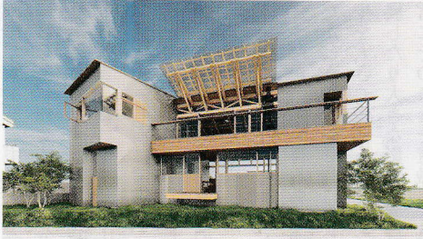
窓をテーマに設計した住宅のCG パース1

表面的に皆さんの目に触れるカタチは、建築家の数えきれないほどの真剣な「判断」の集積によって生み出されているものなのだ、今度からぜひそんな目で建築を眺めてみてください。